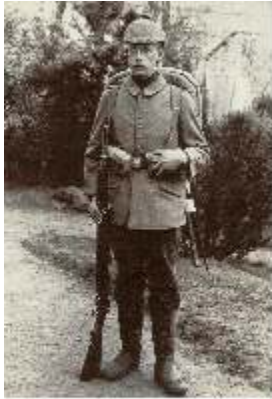
Fuglsang-Damgaard blev tvangsudskrevet til den tyske hær under 1. Verdenskrig, så han vidste noget om krigens rædsler

– for ikke selv at risikere at være den, der stod på den forkerte side af historien.